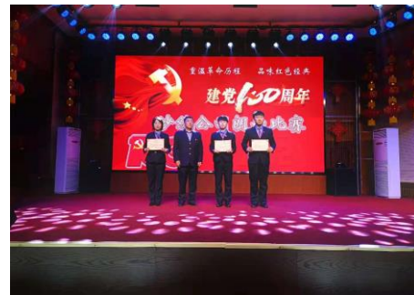
图 3.4 主题演讲比赛